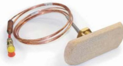
CFS 50 cod. R10232.50